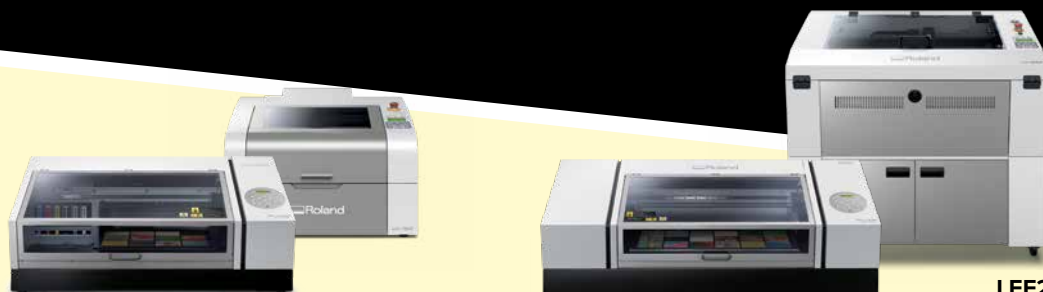
LEF2-200 / LV-180

Avec les imprimantes UV LED VersaUV LEF2, vous pouvez imprimer des couleurs, des textures et des reliefs 3D simulés incroyablement réalistes, avec des finitions brillantes et mates sur des objets et supports jusqu'à 100 mm d'épaisseur. Lorsque vous les associez à une machine de gravure laser LV, vous disposez d'une solution puissante et intégrée pour créer à la demande des articles personnalisés haut de gamme. Produisez rapidement et aisément des gabarits pour les articles que vous souhaitez imprimer sur votre LEF afin de réduire les temps de préparation et d'assurer des résultats d'impression précis.